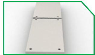
บริเวณอุดโป๊วและรอยต่อ