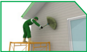
ทำความสะอาดพื้นผิว