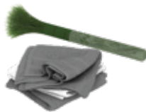
อุปกรณ์ทำความสะอาด