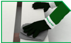
ทำความสะอาดพื้นผิว